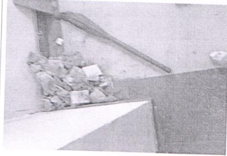
वार्ड में गंदगी एवं झाड़ू का उपयोग