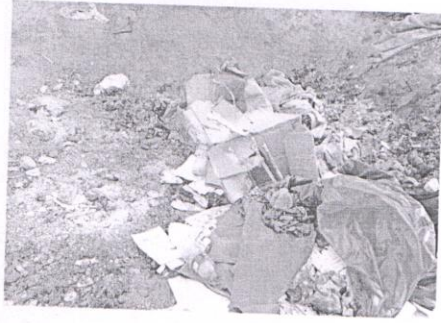
अव्यवस्थित डीप वरीयल पिट